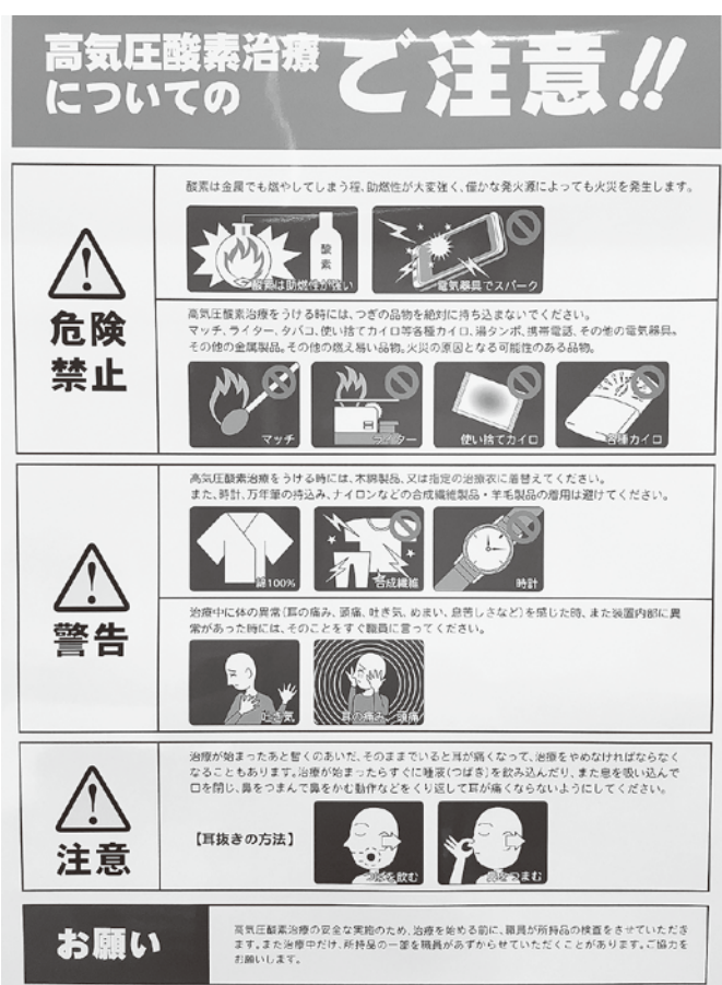
【写真2】治療時の注意事項

火気厳禁▽酸素は金属でも燃やしてしまうほど可燃性が大変強く、わずかな点火源によっても火事を発生します。よって治療室内は火気厳禁です。ライター・タバコ等一切持ち込めません。トイレを必ず済ませておく▽治療時間は90分間で、治療途中ですぐに装置から出ることができない(減圧する時間が必要)ため、治療前にトイレを済ませておくことが大事です。